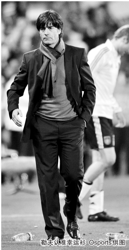
勒夫认准幸运衫