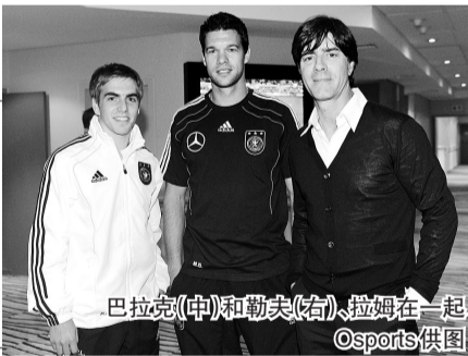
巴拉克(中)和勒夫(右)、拉姆在一起

接受德国《图片报》采访时,巴拉克表示希望德国队能坚持到最后,他认为德国将3:1击败阿根廷。