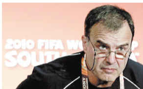
② 他是不是真的吃了？