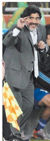
④ 就吃了那么一点点。