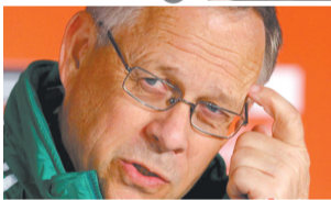
③ 他到底吃了几块啊！