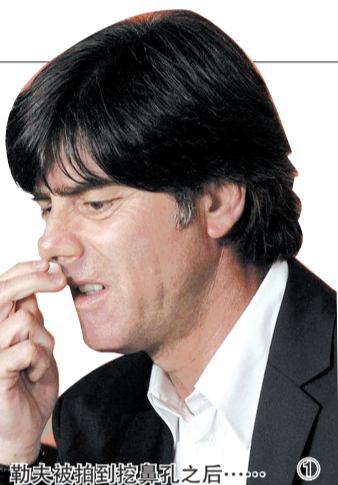
勒夫被拍到挖鼻孔之后……