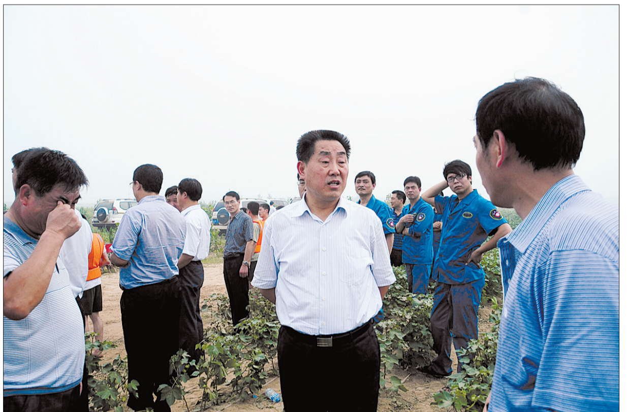
副省长刘满仓在现场指挥救援工作。