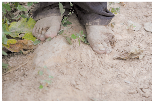
一名被困人员被救上岸后在地头等待。