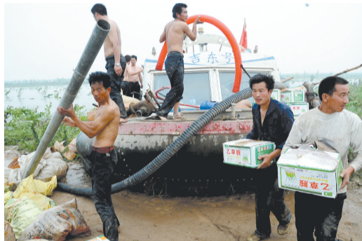
气垫船安全地把被困人员和物资运送到岸边。

武陟县近百名工作人员正两人一组,把装有种子的麻袋、播种的设备抬上三轮车,将这些老百姓的宝贝运离岸边。