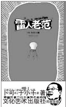
下可 于小手 著 文化艺术出版社

米粒儿劝道:“大来哥,活儿是永远都做不完的,悠着点儿干。下班了我帮你洗衣裳吧。”许大来一脸甜蜜,顿时精神抖擞。两个人说说笑笑,不远的秦琼看得两眼直冒火。