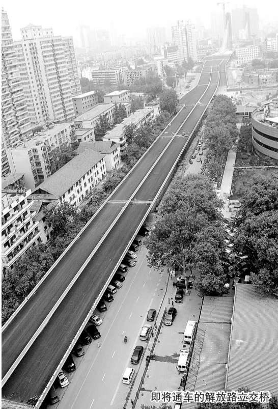
即将通车的解放路立交桥