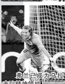
弗兰已成为乌拉圭队精神领袖