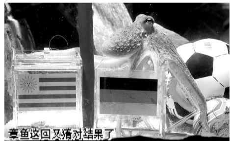
章鱼这回又猜对结果了