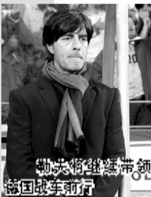
勒夫将继续带领德国战车前行