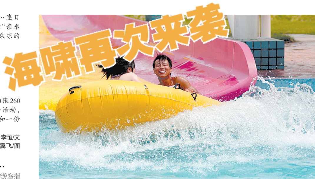
黄河谷·马拉湾海浪浴场

她是中原新崛起的亚洲一流水上主题乐园,以中华民族的母亲河黄河为背景,与丰乐农庄国家3A级旅游景区融为一体,占地3000亩。