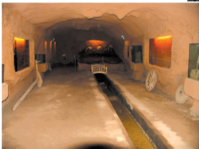
▲▶ 传说中的坎儿井, 或藏于地下, 或若隐若现。

多走一个小时,就到了亚洲最大的风力发电站。站在发电站的停车场,看着一眼望不到边的发电风车不停地旋转,有一种极度震撼的感觉。关于这些大风车,当地有一个很形象的笑话。一个淳朴的维吾尔族老大爷第一次从吐鲁番的农村到乌鲁木齐时,路过这里就对身边的人说: “我终于明白吐鲁番为什么热了,因为乌鲁木齐人在家门口装了这么多电风扇,把凉风吹到乌鲁木齐,热风全部都吹到我们吐鲁番了。”