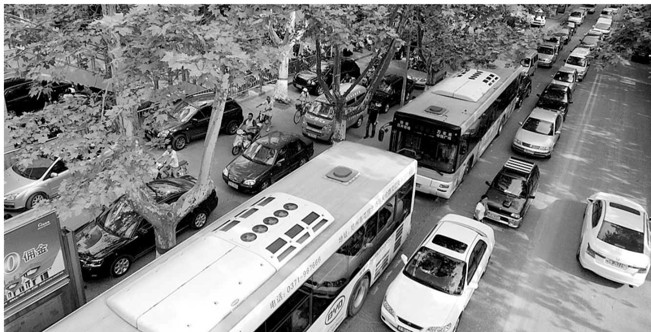
京广路修路难走,“借道”车流分流至大学路,造成这里经常拥堵。