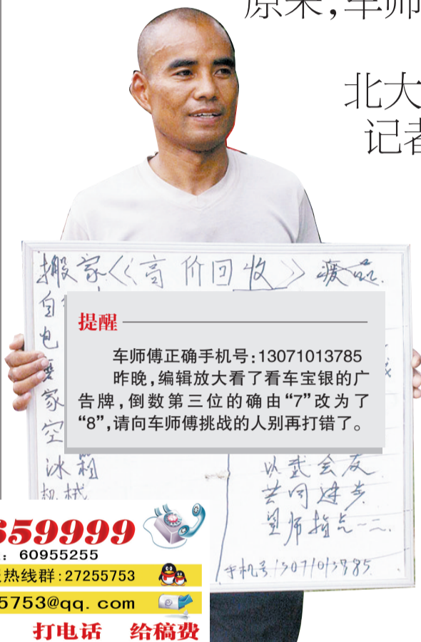
□晚报记者 张玉东/文

原来,车师傅昨天发出挑战令后怕遭群殴 手机号偷偷改了一位 北大学城弓先生被骚扰了一上午 记者向弓先生解释后,他连说理解 “我的弟弟也是一名练武之人”