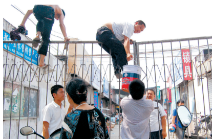
□晚报记者 张璇/文

租金要涨 商户锁了北建材的门 做生意,讲究和气生财 这个道理 相信商户和管理方都明白