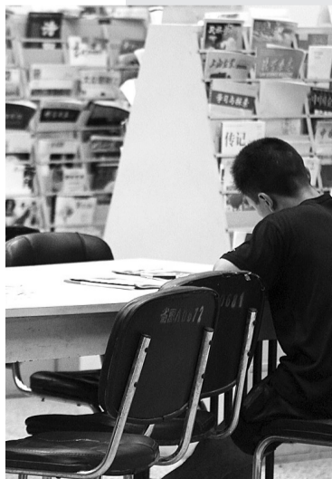
省图书馆里,稀稀拉拉的读书人。