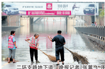
二环支路地下道