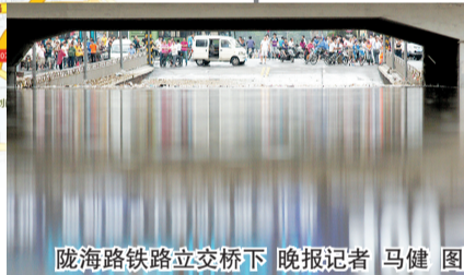
陇海路铁路立交桥下

答5：在城市防洪中具有特别用途的方涵、明沟，这几年占压严重，致使这些泄洪通道被堵塞，使城市有积水时不能及时排水，最终致使道路被淹。