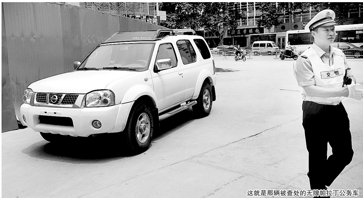
这就是那辆被查处的无牌帕拉丁公务车

无牌帕拉丁是中牟县公安局的 黑色“红旗”是市旧城改造公司的 两名司机留用察看一年