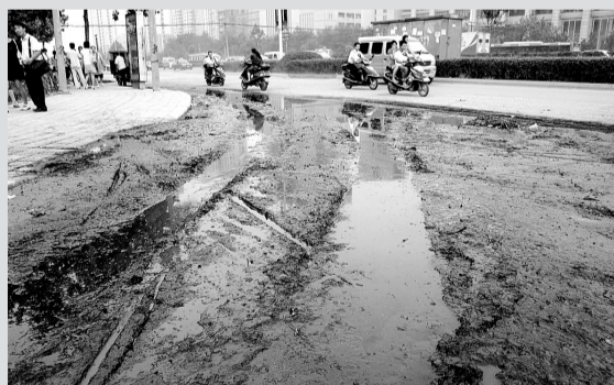
昨日下午,河南大学人民武装学院门口的北环路上,淤泥尤其多。晚报记者 周雨 图