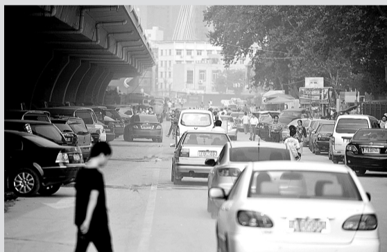
建设东路高架桥下,路边停放的车辆占据了通道,堵车现象时有发生。

交警三大队一民警表示,尽管金水路桥下、建设路桥下和大学路桥下有5个停车场,但很多人为了图方便就随意把车停在了路边。交警在此贴条贴到手软,一趟下来能贴两本多,100多张。