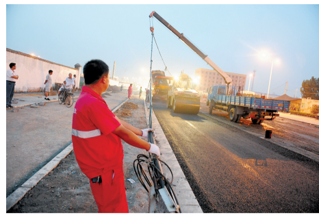
昨天下午,这里开始铺沥青了。

昨天下午3点48分,记者再次来到五龙口断头路施工现场。施工紧张有序进行,工人正在做铺沥青前的路面清理工作。路面已经没有积水,大雨冲刷带来的泥沙也已经被清理干净。负责此段的郑州第二市政重点工程项目部工作人员介绍,18日下大雨,19日的重点工作是清除积水,原本计划中的铺沥青工作被迫后延,虽然工程被迫延工将近一天,但已完工的工程没有遭到破坏。记者在现场看到,当地居民反映的几个问题正得到解决。工人们正在铺设人行道石砖,已经完工近2/3;路中间的线杆正被有关单位移除,已经移除的4根线杆放在路边等待统一处理。下午4点29分,装满沥青的卡车到达现场,一旁待命的工人早已在施工路段周围安放好警示桩,以提醒过往车辆、行人避让。工程队的李队长说,最晚22日完工。