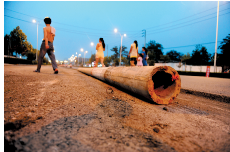
路中间的线杆被拔出来了。