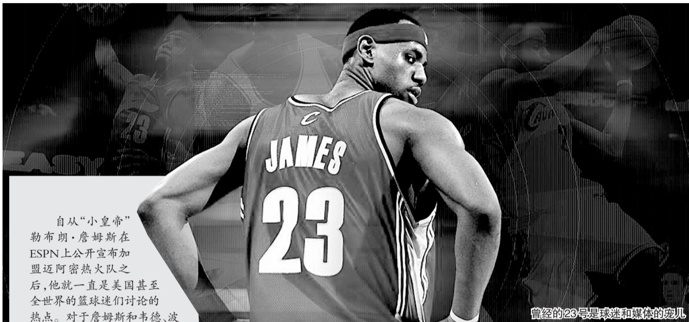
曾经的23号是球迷和媒体的宠儿

自从“小皇帝”勒布朗·詹姆斯在ESPN上公开宣布加盟迈阿密热火队之后,他就一直是美国甚至全世界的篮球迷们讨论的热点。对于詹姆斯和韦德、波什组成“热火三巨头”,外界褒贬不一。当然,最气愤、最失望的是骑士球迷,骑士老板吉尔伯特因为公开斥责詹姆斯,被联盟处以10万美元罚款。