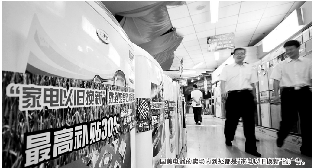
国美电器的卖场内到处都是“家电以旧换新”的广告。

承担家电以旧换新任务的企业包括家电销售企业、家电回收企业和拆解处理企业。家电销售企业、家电回收企业以省商务厅和省财政厅招标形式确定,招标结果在15个工作日内报商务部、财政部并向社会公布。家电拆解处理企业由省环境保护厅筛选,报省政府确定。