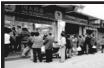
火爆! 亿生康补贴首日 我市出现弃药抢表高峰

公益救助(仅此一次,最后追加的500块送完为止,救助结束后,在各大药店598元/块也能买到。由于本次活动系公益性性质,请领取时携带本人身份证,每人最多限领2块,手续费99元/块自理。