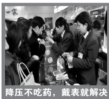
降压不吃药,戴表就解决

而戴表降压则不同,戴上亿生康,血压慢慢平稳了,降下来了,24小时不高不低,规避了血压过高易引发脑溢血,血压过低导致心梗的危