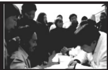
着急! 最多两块 挤了半天还没轮上