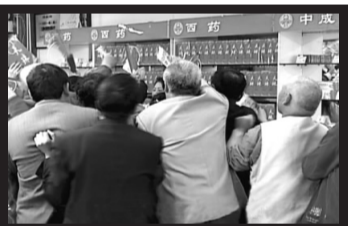
感谢! 只收手续费 感谢这么好的政策