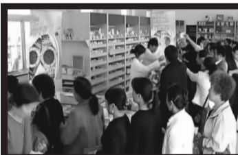
等待! 免费送说到做到 下班了也要延时办理