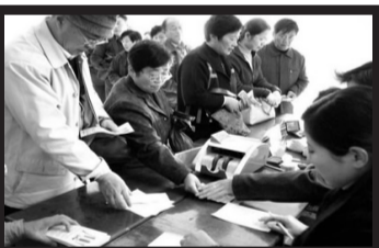
机会! 这回错过了 可就要永远错过了