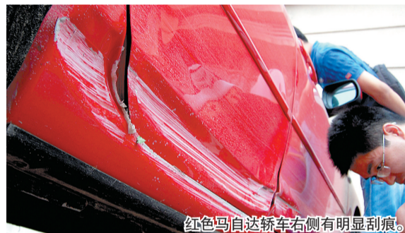
红色马自达轿车右侧有明显刮痕。