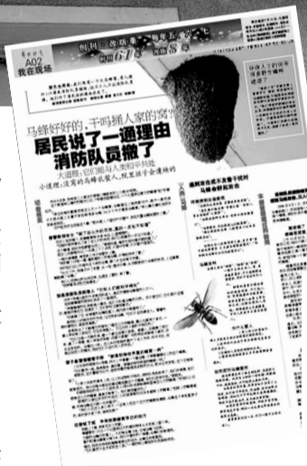
▲这是本报6月26日的报道

67659999 东区热线: 60955255 郑州晚报热线群: 27255753 27255753@qq.com 打电话 给稿费