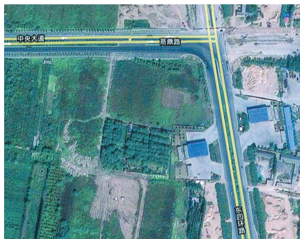
昨日,本报美编找到的网上地图,显然是同一地点。