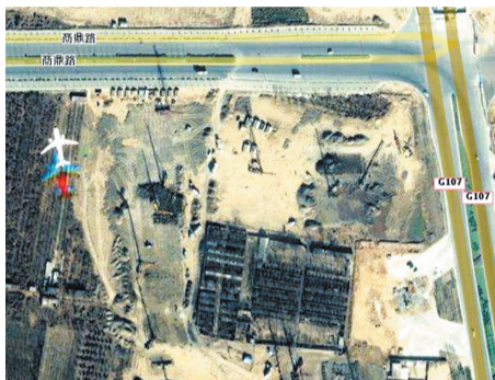
原图:这是架飞机吗?