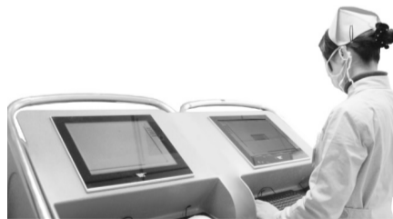
涡流磁透析治疗系统

涡流磁透析技术是集磁能介入、电感应、电渗透的综合治疗方法,在高频电磁场作用下,在前列腺局部形成高于血液浓度10~15倍的药物离子堆,能使前列腺组织细胞表层下3cm深部位的病变组织细胞脱水缩小,细胞代谢紊乱,发生变性、凝固、坏死、脱落,正常组织管口被疏通,其内炎性渗出物、坏死组织、病原体及其毒素被磁能涡流形成的负压吸引排出体外,实现一通脂质包膜,二通腺管,三通尿路,从而使病变组织缩小恢复正常,解除排尿困难,彻底消除炎症,并成功的解决了前列腺疾病反复发作、迁延难愈的难题。