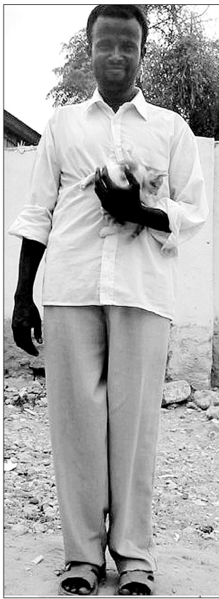
周先生拍的索马里海盗照片。