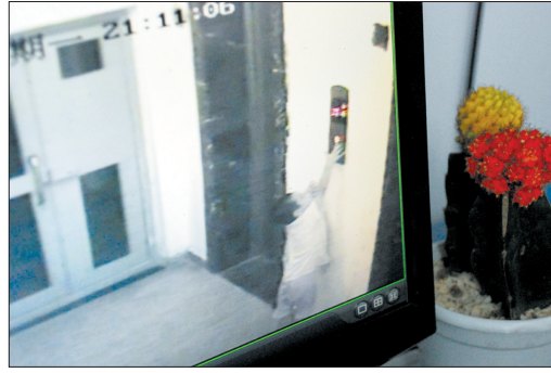
监控录像显示,小朱瑞跳起来按下楼键。