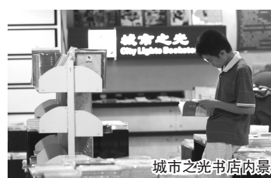
城市之光书店内景