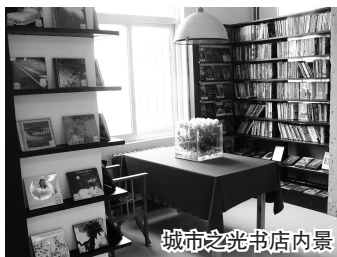
城市之光书店内景

“如切如磋、如琢如磨”之后,城市之光宛如一间漂亮的创意工作坊。据说设计师对其设计也颇为满意,携城市之光的设计方案参加“2006年亚太地区室内设计双年大奖赛”,成功入围商业空间设计奖前10名。独特的设计使得不少人尚未亲身体验郑州城市之光,就已熟知其黑、红、灰、白的色调搭配和渐次宽敞的楼梯设计。