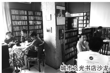
城市之光书店沙龙