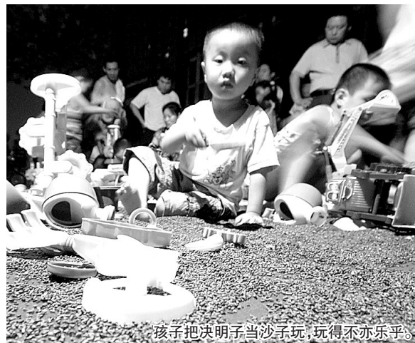
孩子把决明子当沙子玩,玩得不亦乐乎。