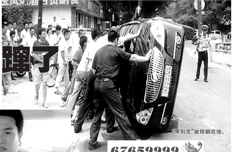
“黑别克”被掀翻在地。