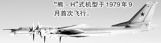
北约战机(上)跟踪图-95轰炸机

图-95“熊”式轰炸机上世纪50年代开始服役。它最长飞行距离超过1万公里,可携带8枚射程达3000公里的KH-55型核导弹。“熊-H”式机型于1979年9月首次飞行。