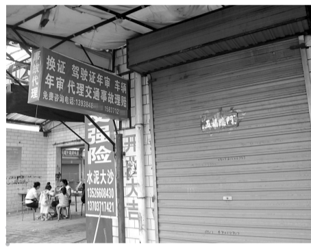
刘某的“事故代理、换证、年审”的店面。