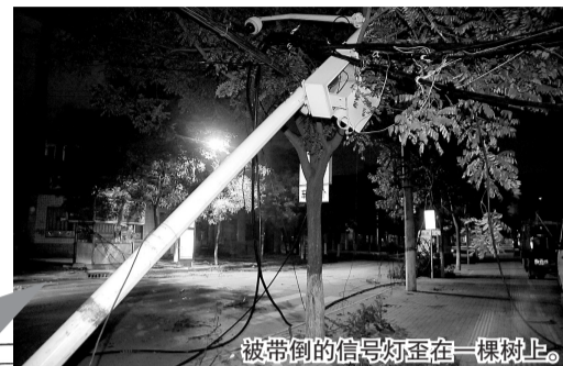
被带倒的信号灯歪在一棵树上。