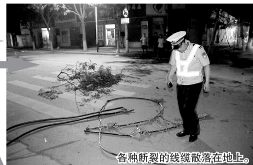
各种断裂的线缆散落在地上。