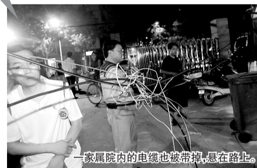
一家属院内的线缆也被带掉,悬在路上。