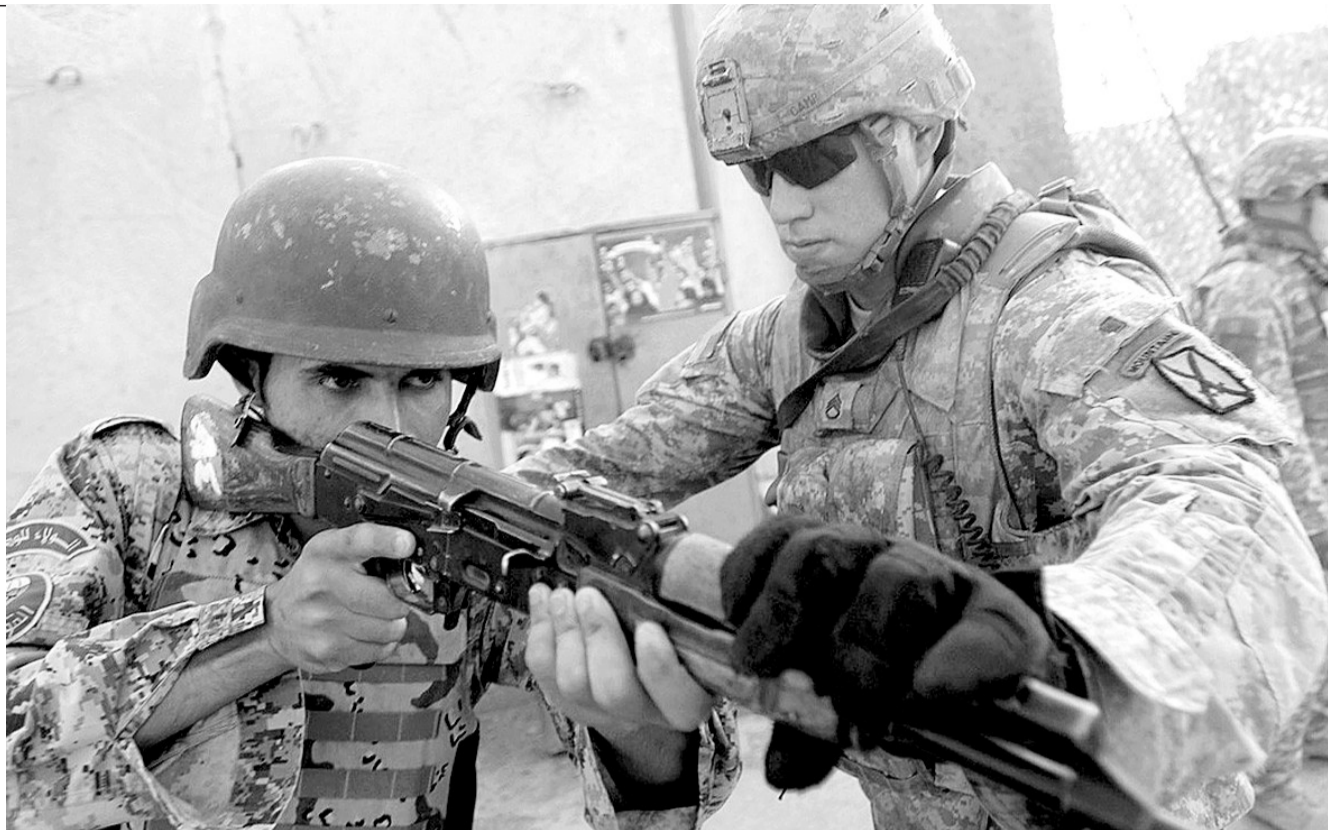
2008年8月25日,在伊拉克首都巴格达附近,一名美军顾问在训练伊军士兵。今年8月31日后,这将成为驻伊拉克美军的头等任务之一。

美国媒体评论,随着国会中期选举临近,奥巴马政府试图向外界突出任内取得的政绩,为民主党争取更多支持。