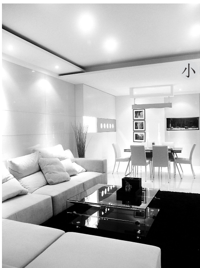
小户型装修 面积:60平方米以下