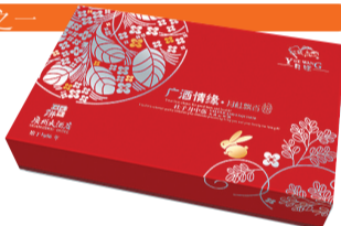
广酒情缘系列——月桂飘香每盒156元

广酒月旺月饼是河南省第一家生产广式月饼,第一家荣获中国名饼,第一家中国月饼公正十佳品牌,第一家通过ISO9001国际质量体系认证的月饼生产企业。广酒月旺月饼用料考究、工艺精湛,油润软滑,香甜不腻。今年,广酒月旺带来广酒情缘系列,每盒售价156元,广酒贡月每盒396元,广酒集锦每盒268元,中秋集锦系列每盒186元,我爱我家每盒108元,苏式月饼每盒86元,广酒情每盒76元,杂粮集锦每盒216元。