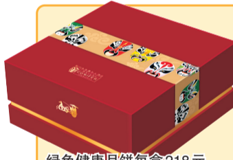
绿色健康月饼每盒218元

郑州未来康年大酒店是河南酒店业首家取得月饼QS认证的酒店,采用拥有QS资质的厂商提供的月饼原材料。酒店今年月饼的定价自每盒118元起分为高中低三个档次,口味方面,酒店保留了传统的蛋黄白莲蓉及五仁,还在传统中求新意,推出了酥皮粒粒红豆月饼、法式奶酪月饼,另外新增了冬虫草花及西梅黑加仑等口味。