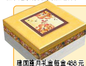
建国尊月礼盒每盒488元

兴亚建国饭店悉心烹制传统节日美食——建国御饼。并推出3款月饼礼盒:建国雅月礼盒168元、建国颂月礼盒价位238元、建国尊月礼盒价位488元。主打产品不仅有豆沙、枣泥、五仁、莲蓉,而且有樱桃芝士、炭烧梅子,还有充满花果香气的玫瑰陷、红酒蔓越莓、芒果乳酪,甚至有符合现代人健康养生的山药、地瓜陷、槟榔香芋等。