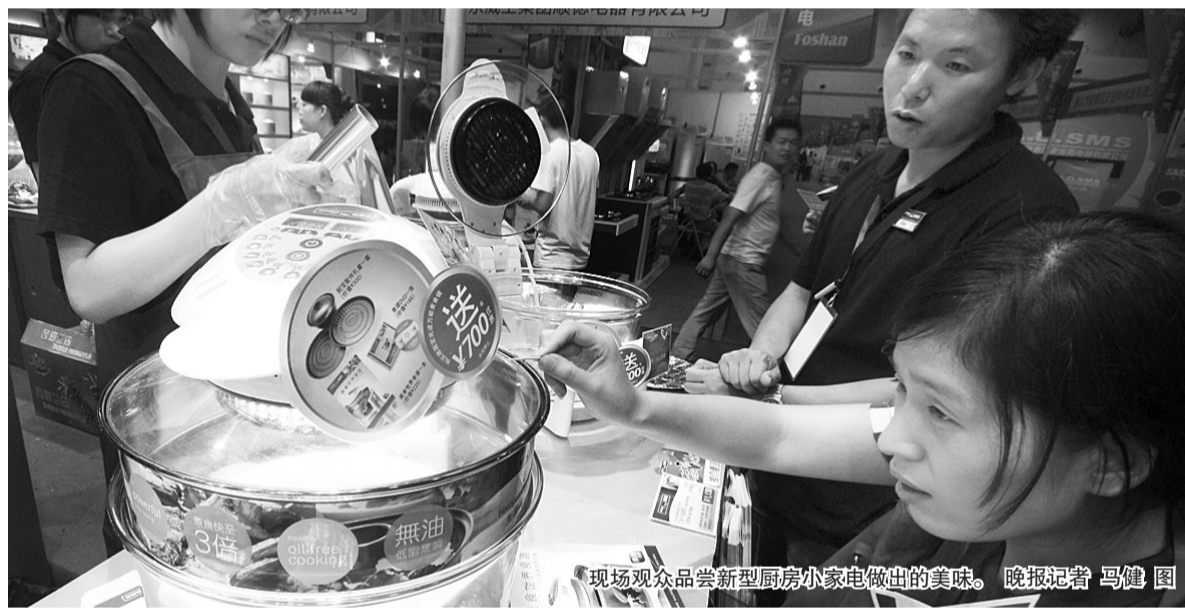
现场观众品尝新型厨房小家电做出的美味。

地点: 中原路与秦岭路 这个电影城位于中原万达广场内,明年11月份建成,届时将成为郑州市档次最高、容纳观众最多的电影场所。 值得一提的是,万达院线的电影可以和美国好莱坞院线直接对接。“也就是说好莱坞电影上映一个月之内,都可以在万达院线上映。”王东亮说。