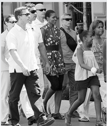
米歇尔母女和保镖入住玛贝拉超豪华5星酒店。

虽然白宫发言人吉布斯表示,第一夫人此行全部自费,不过媒体仍然批评,这次旅行全程的专职特勤保护以及工作人员的费用都将由纳税人买单。