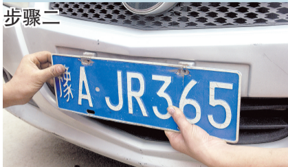
把牌照上端的两个小孔对准铁卡子。