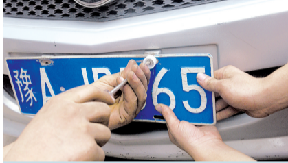
用配套的螺丝将牌照上紧在保险杠上。