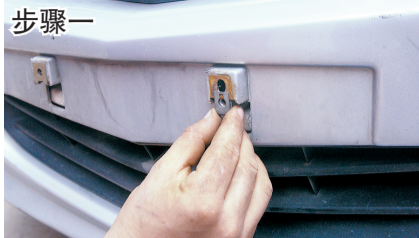
先用两个铁卡子卡到保险杠预留安装车牌的两个小孔。