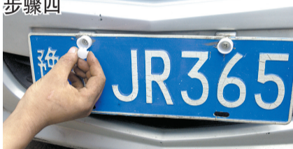
将塑料帽顶端用塑料盖卡上盖住螺丝头,检查是否有松动。