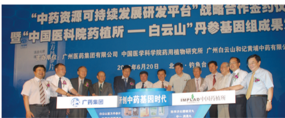
广药集团中药基因成果发布会在钓鱼台国宾馆举行

2010年6月20日,广药集团与中国医科院药用植物研究所联合在北京钓鱼台国宾馆宣告:全球首个