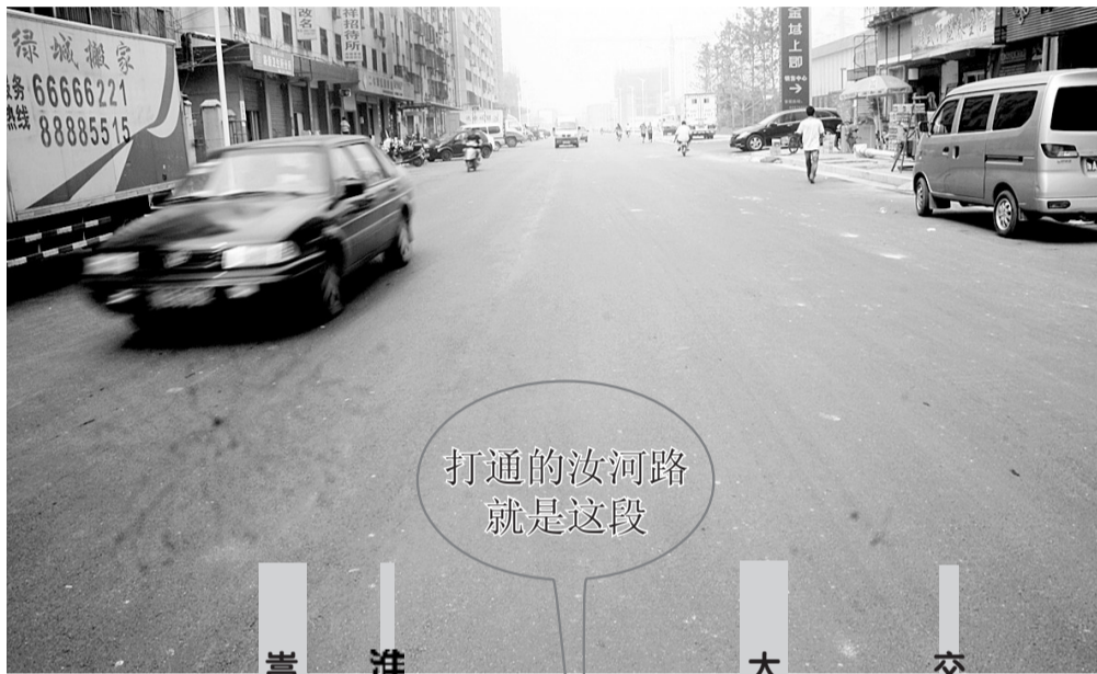
打通的汝河路就是这段