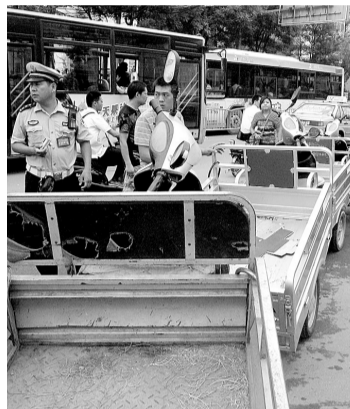
非法占道的三轮车被暂扣拉走