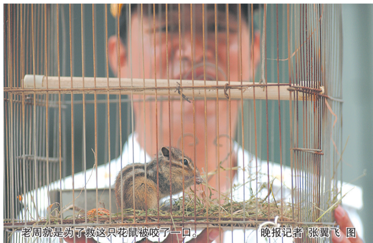
老周就是为了救这只花鼠被咬了一口。