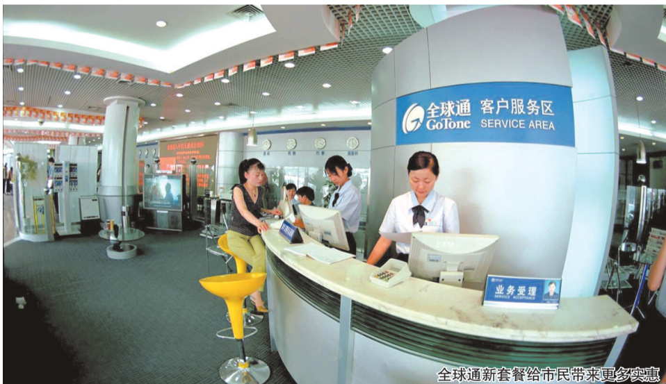
全球通新套餐给市民带来更多实惠