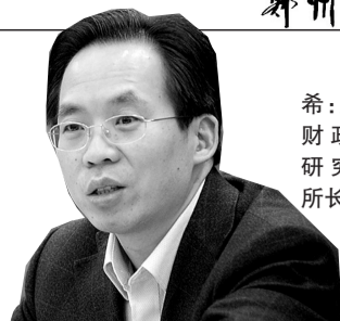
刘尚希:财政部财政科学研究所所长