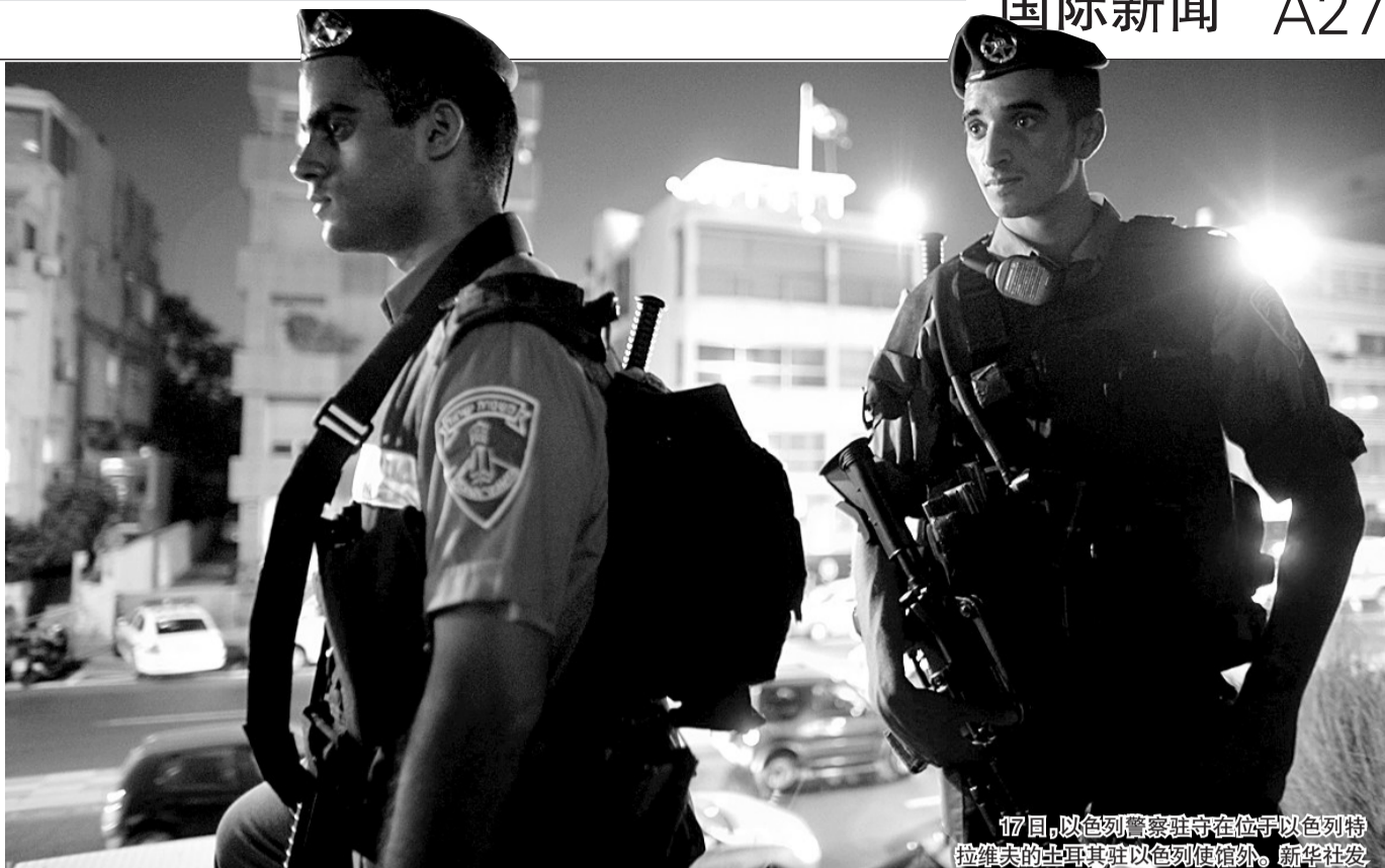
17日,以色列警察驻守在位于以色列特拉维夫的土耳其驻以色列使馆外。

以色列方面出动警察,但未获土耳其方面允许,不能进入使馆。两国因以军袭击援助加沙船队事件关系紧张之际,双方对案件处理尤为小心。