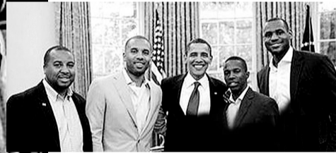
詹姆斯团队接受奥巴马召见

不久前，著名的八卦网站TMZ又登出詹姆斯和他的这帮朋友一起去拜访一位巫师，“皇帝”说已经聘请了此人为他的“心灵导师”，也许他和他的团队真的需要一个导师来指引方向，因为现在，他们已经完全不知道自己在做什么、需要什么——只是，一个巫师？