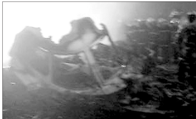
25日凌晨,救援人员在飞机残骸边展开救援工作(手机拍摄)。新华社发

新华社快讯:伊春失事飞机是在机场降落时冲出跑道起火,截至23时30分,伊春市医疗卫生部门已收治20余名飞机失事伤员。