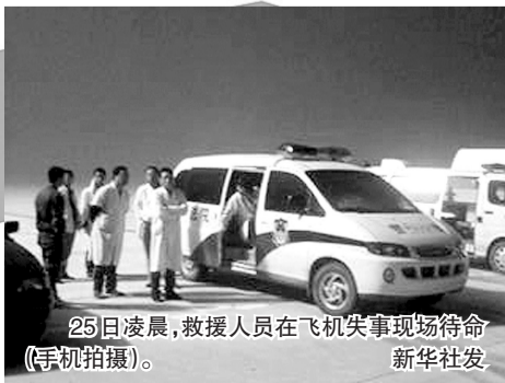
25日凌晨,救援人员在飞机失事现场待命(手机拍摄)。

翼展:28.72米 机长:36.24米 高度:10.57米 最大起飞总重:47790千克(STD型), 50300千克(LR型), 51800千克(AR型) 最大载油量:12872公斤 动力装置:通用电器公司CF34-10E发动机 巡航速度:0.82马赫 载客量:98-106人 客舱布局:2-2 最大航程:4260公里