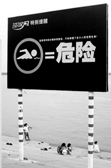
▲宝塔湾岸边有很多这样的提示牌。