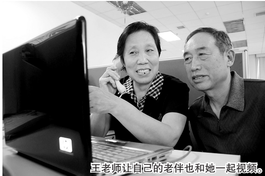
王老师让自己的老伴也和她一起视频。

这次见面会相隔30多年，当年风华正茂的老师已经是退休在家的老人，当年青涩的学生已经人到中年。