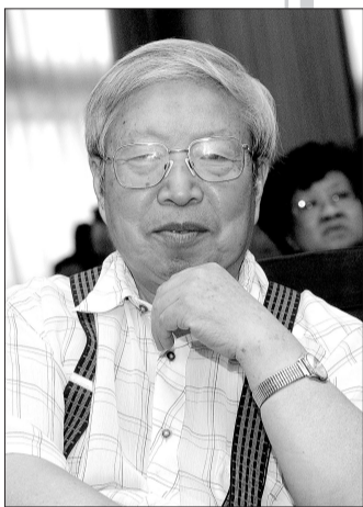
李成勋,著名经济学家、中国社科院研究员、中国管理科学研究院经济论坛专家委员会主任、中国发展战略研究会副理事长。