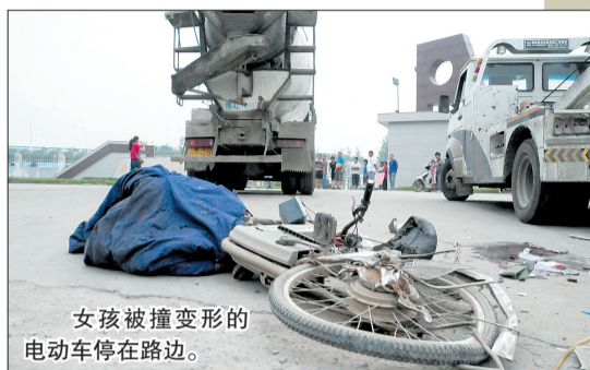
女孩被撞变形的 电动车停在路边。