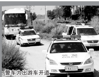
警车为出游车开道