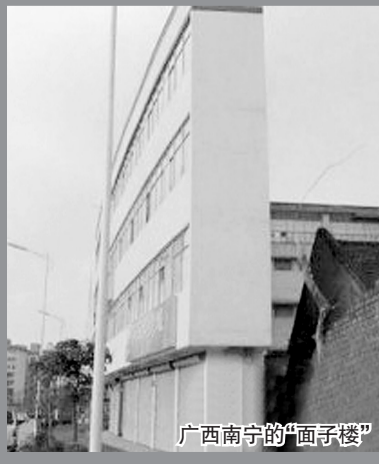
广西南宁的“面子楼”