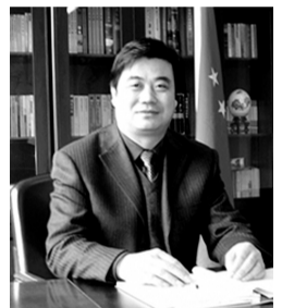
河北省万全县长王聪著在宿舍自缢死亡。

近日,连续两起官员自杀事件再次把“官员非正常”死亡引入公众视野:8月25日河北省万全县长王聪著在宿舍自缢死亡;27日,江苏射阳县纪委的一名干部在该县人民医院住院部大楼跳楼自杀,当地警方随后公布死者生前患抑郁症,生前不存在任何经济问题。