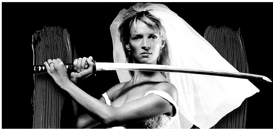
乌玛·瑟曼在电影《杀死比尔》中的新娘扮相。逃婚的都像她这么厉害,估计赏金猎人没戏了。